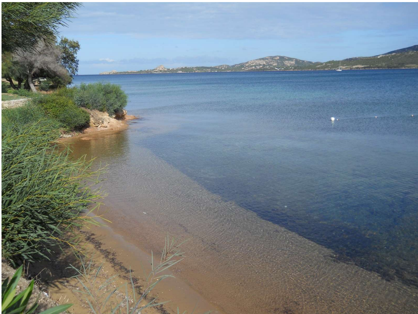
21/10/16 Spiaggia a Cannigione