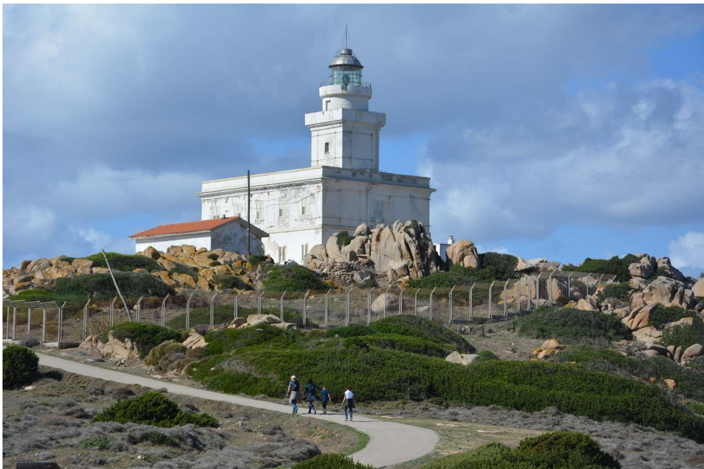
21/10/16 Capo Testa il faro