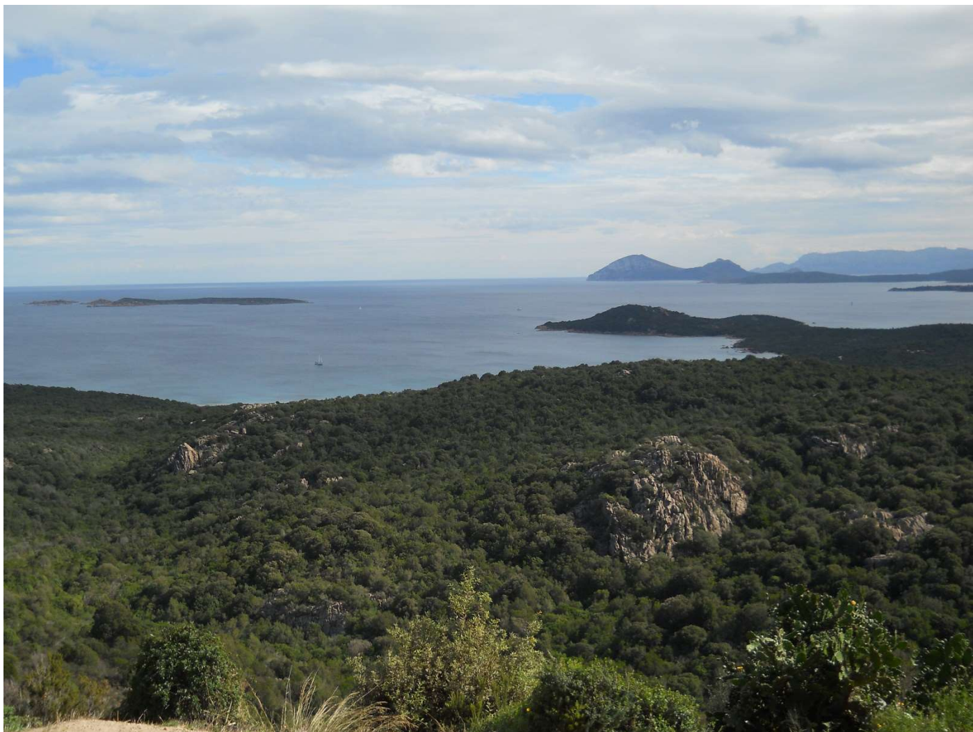
21/10/16 Panoramica su uno scorcio della costa Smeralda