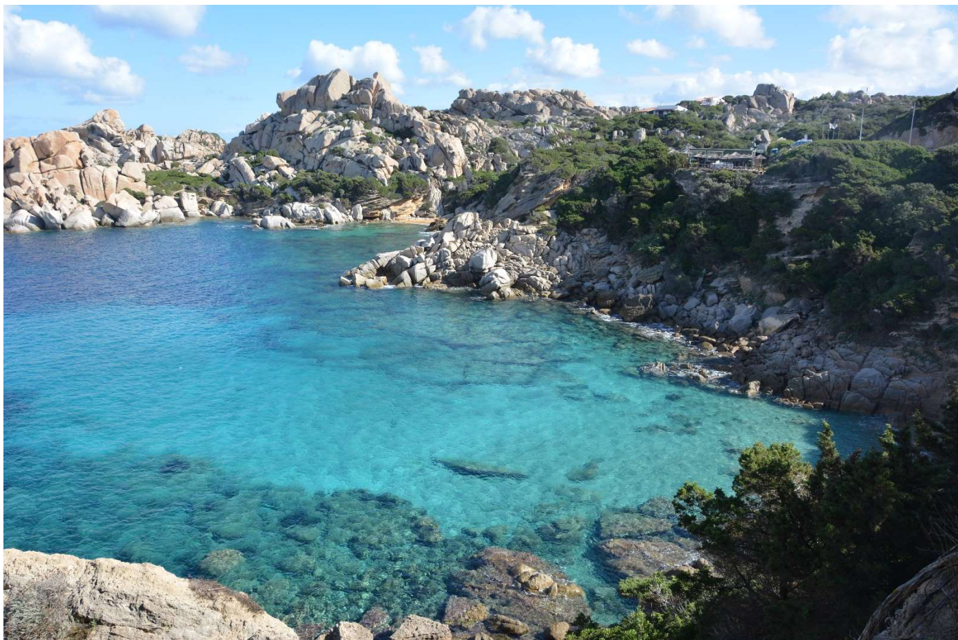
21/10/16 Capo Testa splendida insenatura