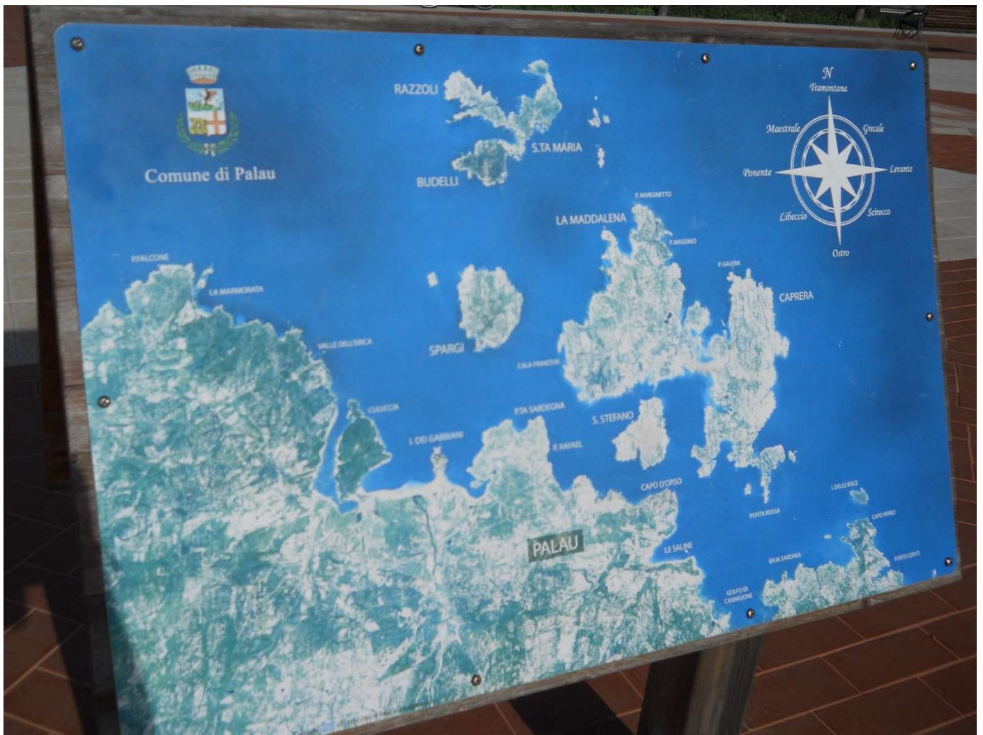
21/10/16 Cartello informativo geografico dell'arcipelago della Maddalena