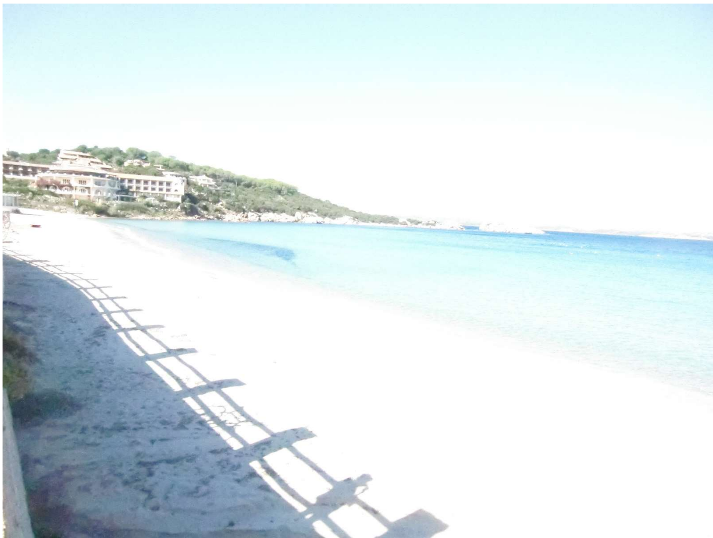
21/10/16 Baia Sardinia spiaggia