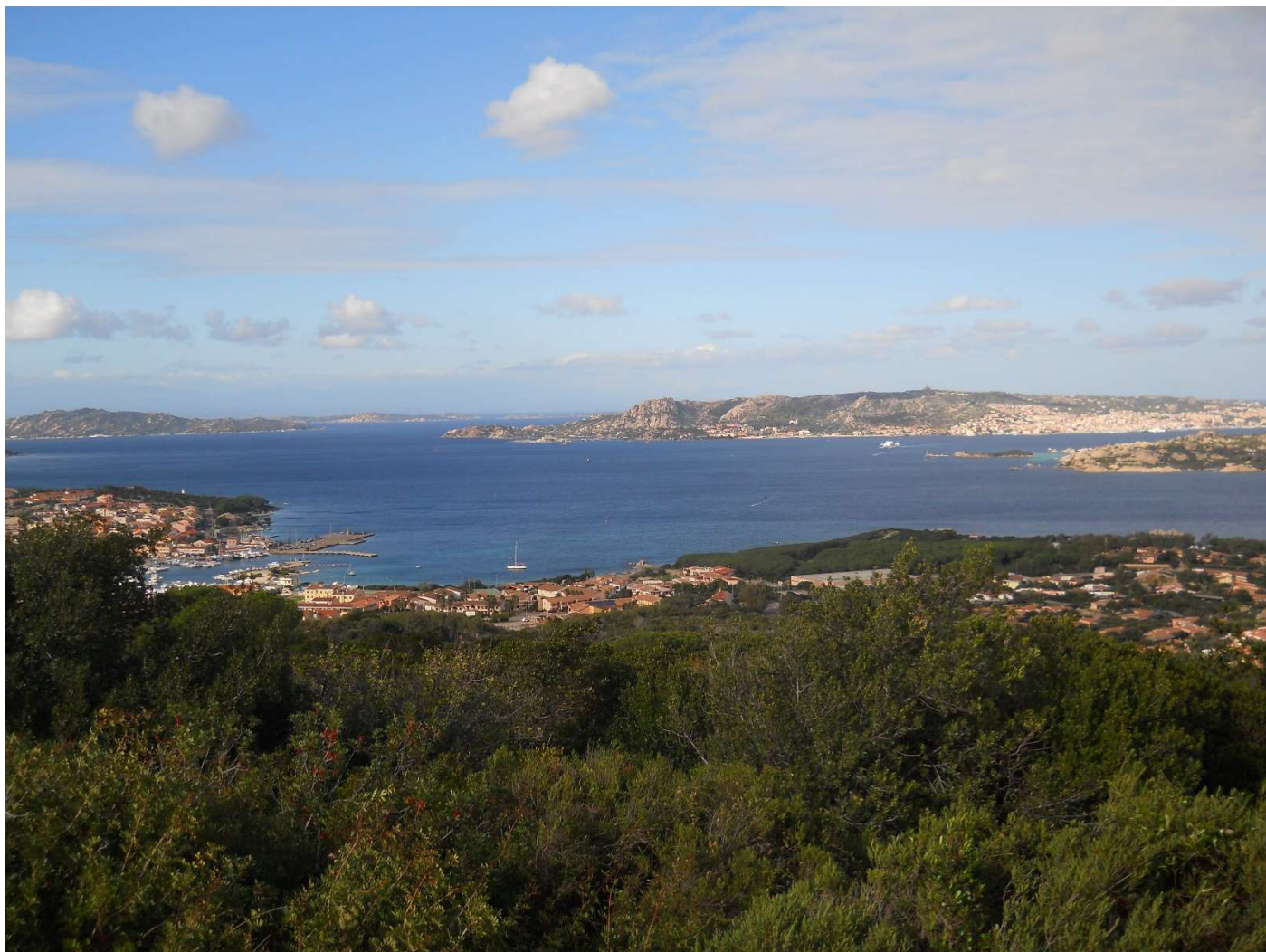
21/10/16 Panoramica sull'arcipelago della Maddalena dalla bici di Igor