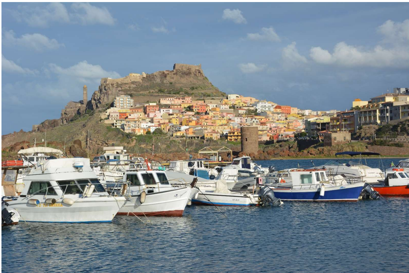
21/10/16 Castelsardo il porto e panorama