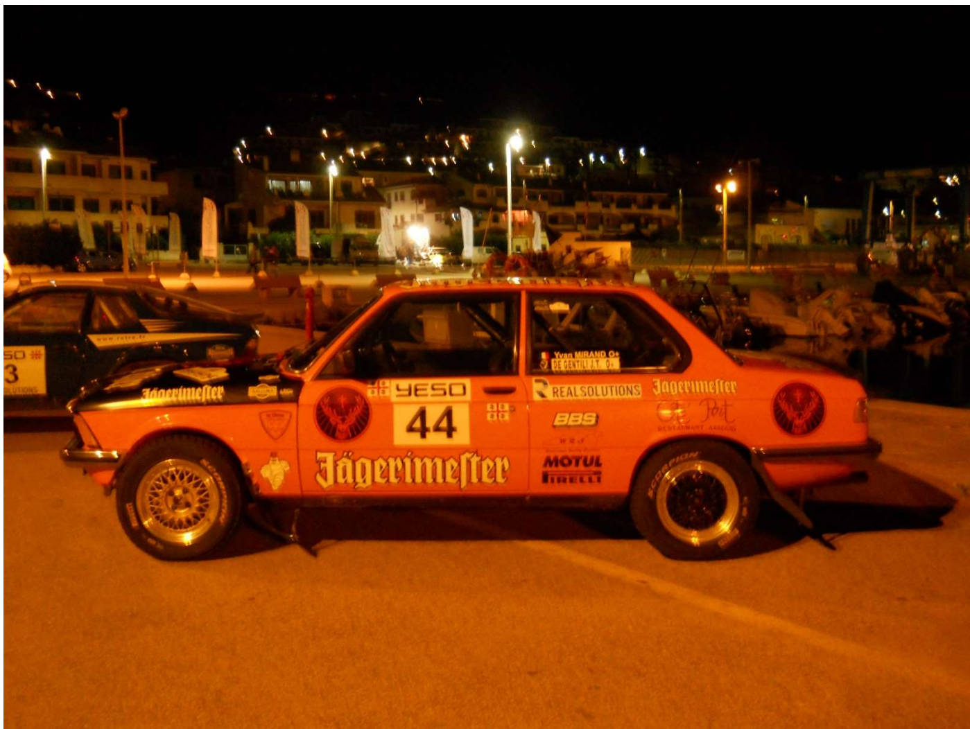
21/10/16 Palau zona porto. Una delle tante vetture partecipanti ad un rally (ci hanno accompagnato anche sulla nave del ritorno)