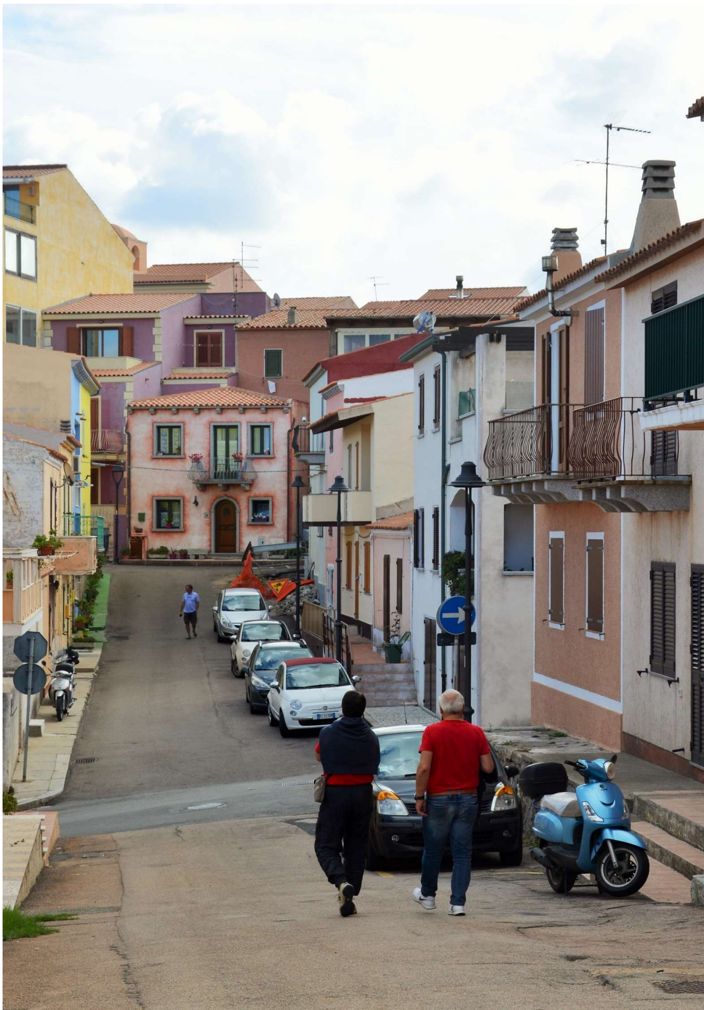
21/10/16 Santa Teresa di Gallura a zonzo per le strade della città (le lunette !!!!!!!!!!!!!!!!!!!!!!!)