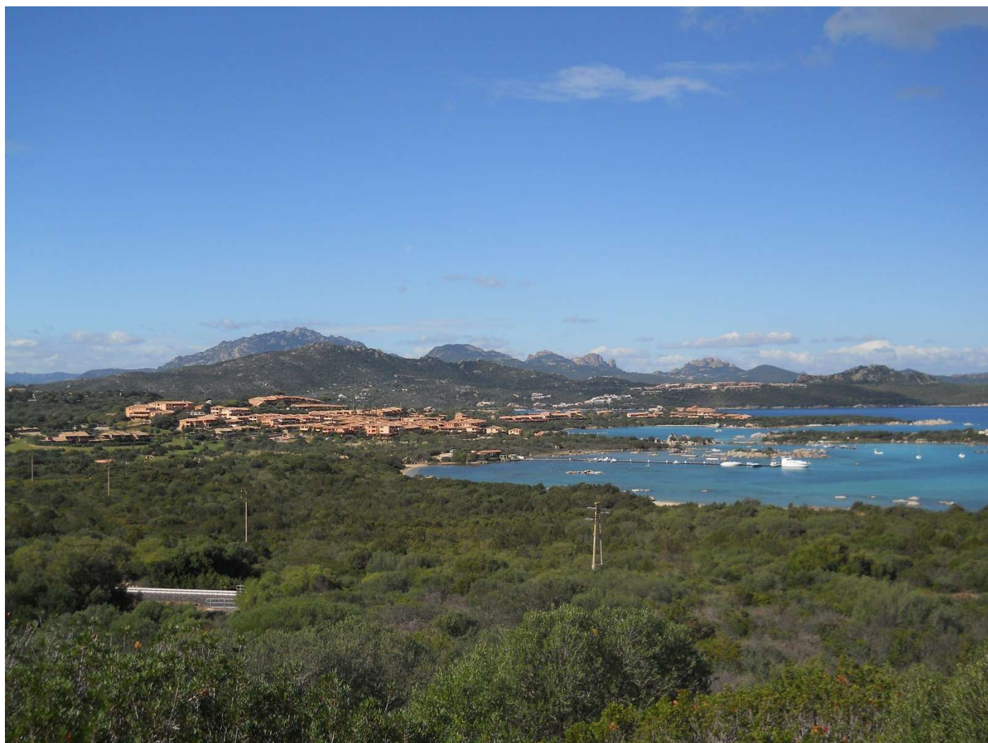
21/10/16 panoramica sulla costa Smeralda dalla bici di Igor