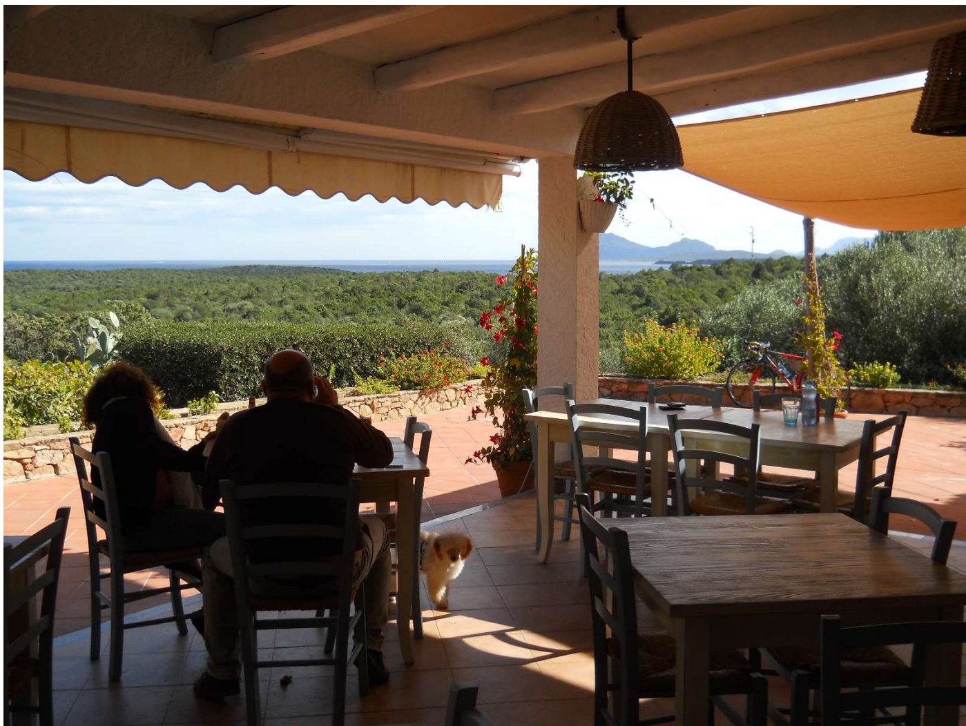
21/10/16 Un bar in costa Smeralda visitato da Igor